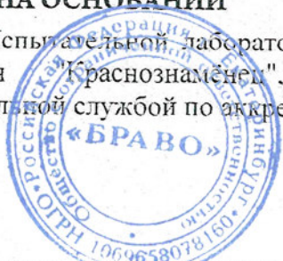
Схема сертификации 7с.

ДОПОЛНИТЕЛЬНАЯ ИНФОРМАЦИЯ Стандарты: ГОСТ Р 51270-99 "Изделия пиротехнические. Общие требования безопасности". Условия хранения: хранить в сухом помещении при температуре не выше +30 С, вдали от нагревательных приборов. Срок годности: до 1 апреля 2022г.