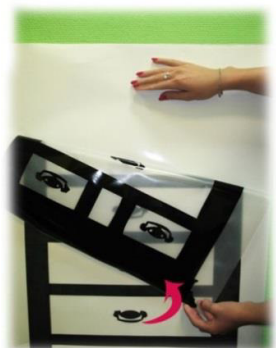
Рис. 4 Шаг 3