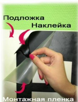
Рис. 1 Строение наклейки