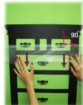
Рис. 6 Шаг 6