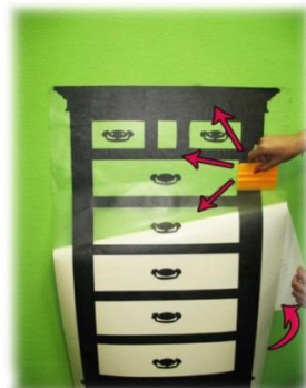
Рис. 5 Шаг 4