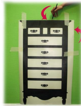
Рис. 3 Шаг 2