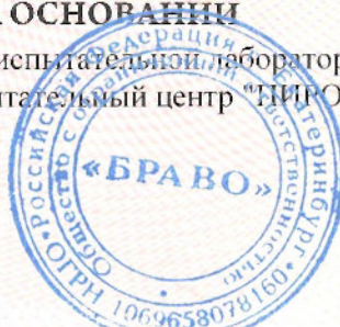
Схема сертификации 8с.

ДОПОЛНИТЕЛЬНАЯ ИНФОРМАЦИЯ ГОСТ 33732 "Изделия пиротехнические. Общие требования безопасности". Хранить в упаковке изготовителя в сухом помещении не ближе 0.5 м от нагревательных приборов, открытых источников огня и легковоспламеняющихся материалов при температуре не выше +30 °С с относительной влажностью не более 65%, исключая попадания на упаковку прямых солнечных лучей и атмосферных осадков. Годен до 31.12.2027.